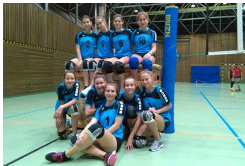
Die U18 ist erfolgreich in die neue Saison gestartet.