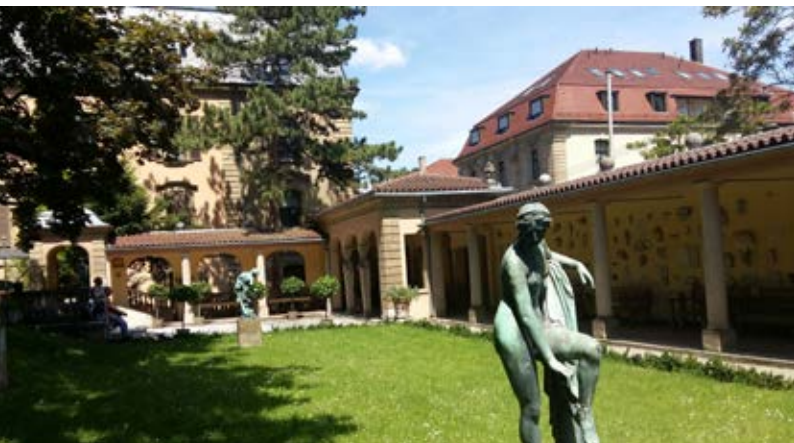
Traumhaftes Wetter im Lapidarium.