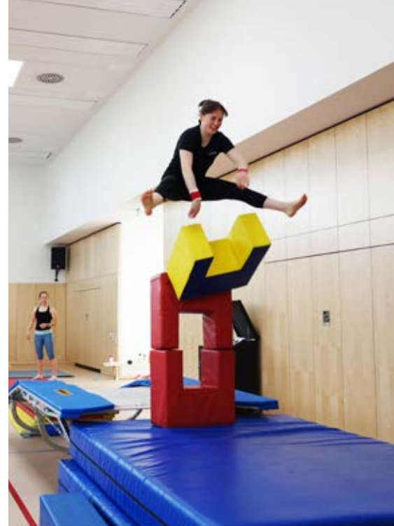
Beim „Jump&Fun“-Special ging es hoch hinaus.