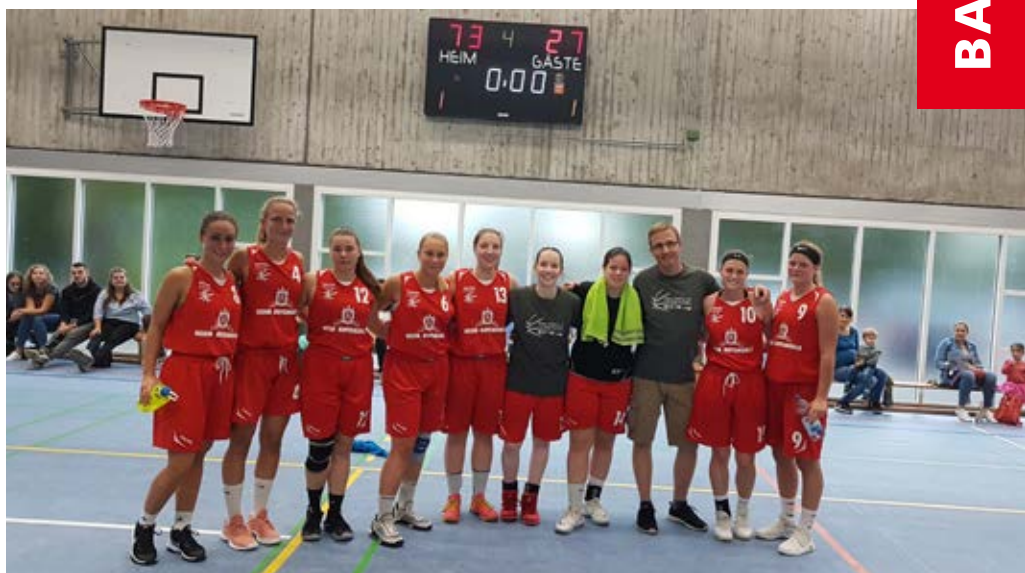
Im ersten Saisonspiel durften sich die Landesligadamen über einen deutlichen Sieg freuen.

Bei der 1. Herrenmannschaft ist ein Aufschwung zu spüren. Das junge, neu zusammengestellte Team möchte in der kommenden Spielzeit wieder oben angreifen. Einige Jugendspieler aus der aktuellen U20 sowie ein paar Rückkehrer aus vergangenen Spielzeiten bilden eine Einheit, die Spielfreude und guten Teambasketball in der BG versprühen soll. Nach einer intensiven Saisonvorbereitung freut sich die Mannschaft auf die