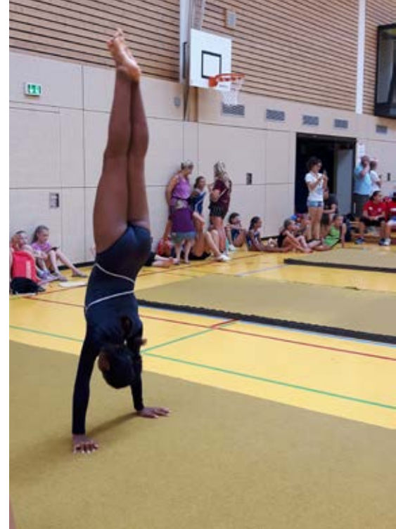
Viele Punkte für einen schönen Handstand.