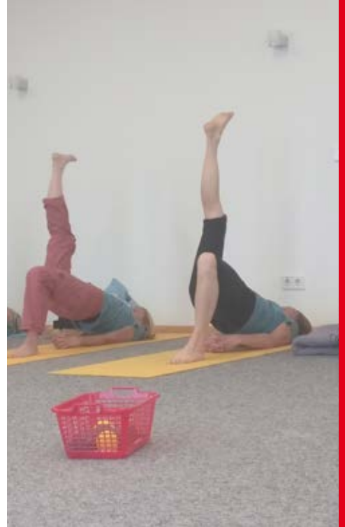
Die Zeit am Bodensee...