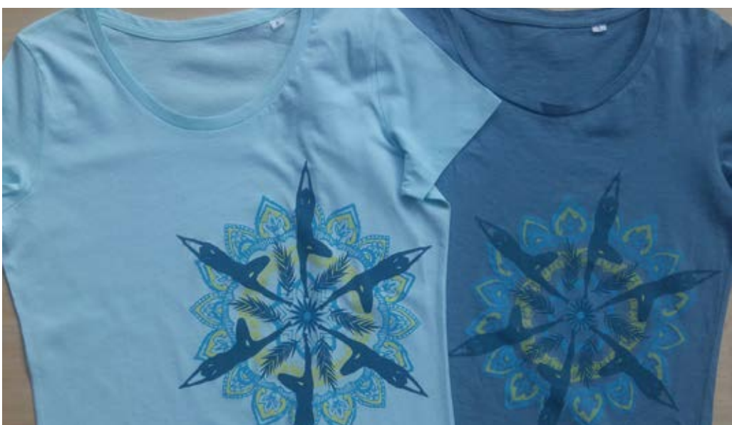
Das Motiv der Yoga-Shirts.