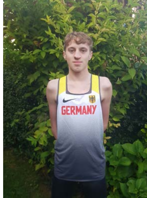
...und im Nationaltrikot.