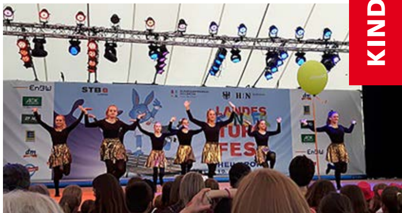
Mitreibende Shows bei der Eröffnungsveranstaltung auf der Sparkassenbühne.