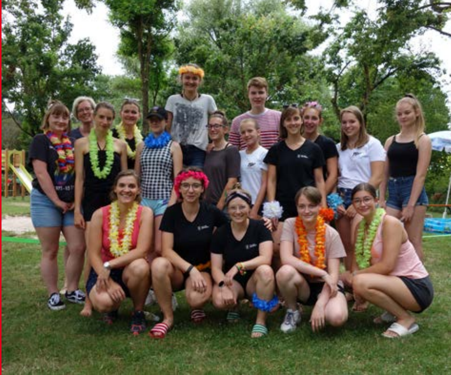
Gruppenbild der vielen fleißigen Helfer.