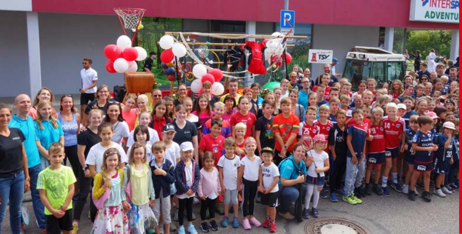
Viele TSV'ler begleiteten den Festzug.