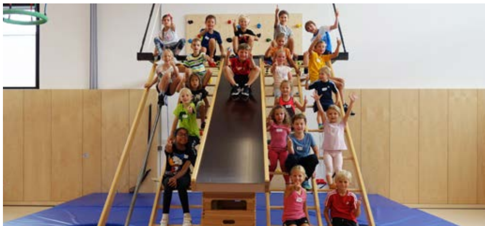
Erschöpfte aber begeisterte Kids.