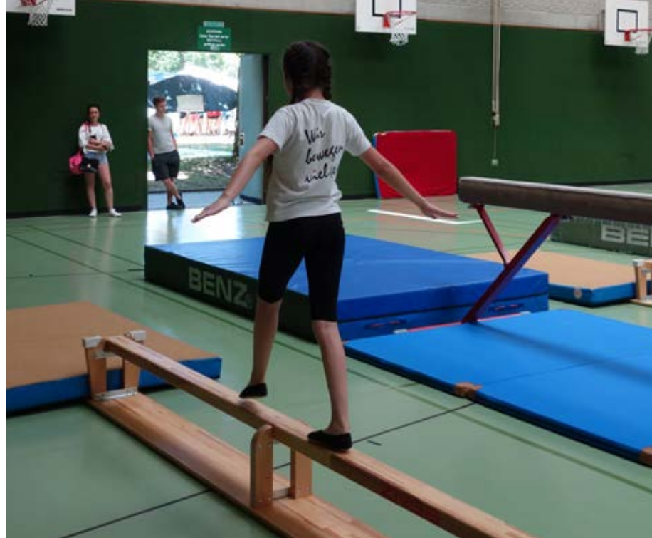
Höchste Konzentration auf der Turnbank.