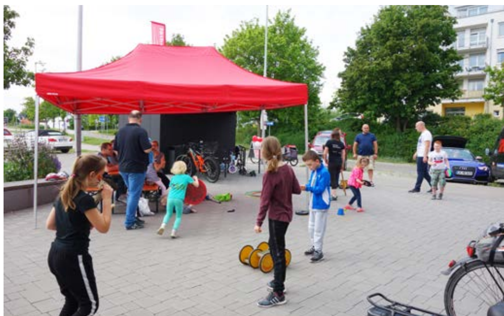
Ob Pedalos, Stelzen oder Balancierkugel – die Kids konnten sich mit zahlreichen Sport- und Spielgeräten der Württembergischen Sportjugend austoben.

Sportjugend bereit. Die Kids bauten sich beispielsweise Hindernisparcours, um diesen anschließend auf Pedalos und Waveboards zu durchfahren. An einer Torwand konnte der perfekte Schuss trainiert werden und mithilfe von Stelzen ging es hoch hinaus. Als sich am Nachmittag der Himmel allmählich verdunkelte, wurde die gemütliche Hocketse kurzerhand nach innen verlegt. Der guten Stimmung tat dies keinen Abbruch.