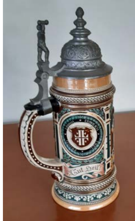
Krug der Bietigheimer Turner von ca. 1920.