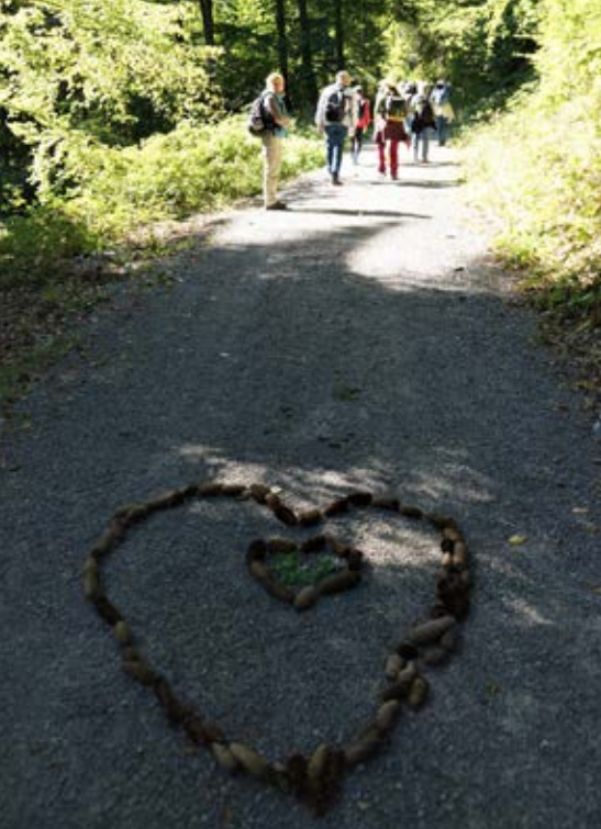
Ein rundherum gelungener Tag in der Natur.