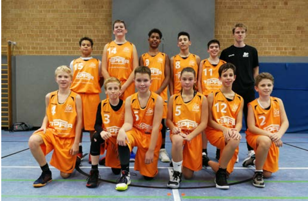
Der Stolz der BG: die U14 männlich spielt in der Oberliga!

In der Jugend ist die BG im männlichen Bereich in allen Altersklassen am Start (U12 bis U20). In der U12, U14 und U16 gibt es sogar je zwei Teams. Die U16, U18- und U20-Jungs spielen mit den