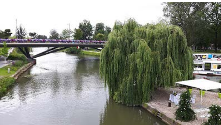
Bunt geschmückt beeindruckt die BUGA mit vielen Attraktionen.