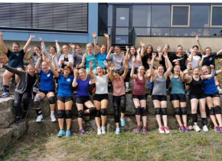
Gute Laune beim Trainings-Wochenende.

Die Ergebnisse spiegeln hier nach Meinung der Trainer jedoch nicht die Leistung wider, zeigte die Mannschaft doch hervorragende Ansätze in Abwehr und