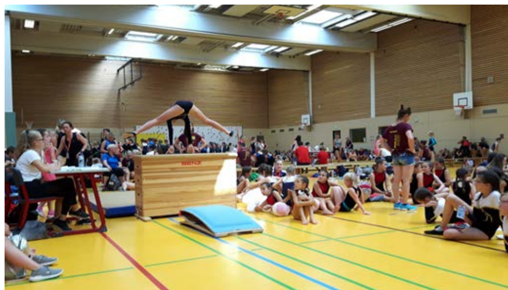
Voller Einsatz beim Wettkampf.

und gesungen und damit alle großen und kleinen Turnfest-Besucher gut unterhalten. Auf einem Kletterturm ließen die TSVler den Abend ausklingen. Aufgrund der Aufregung wegen dem Wettkampf am Samstag, wurde bis nach Mitternacht gespielt und geredet, bis der anstrengende Tag dann doch seinen Tribut forderte.