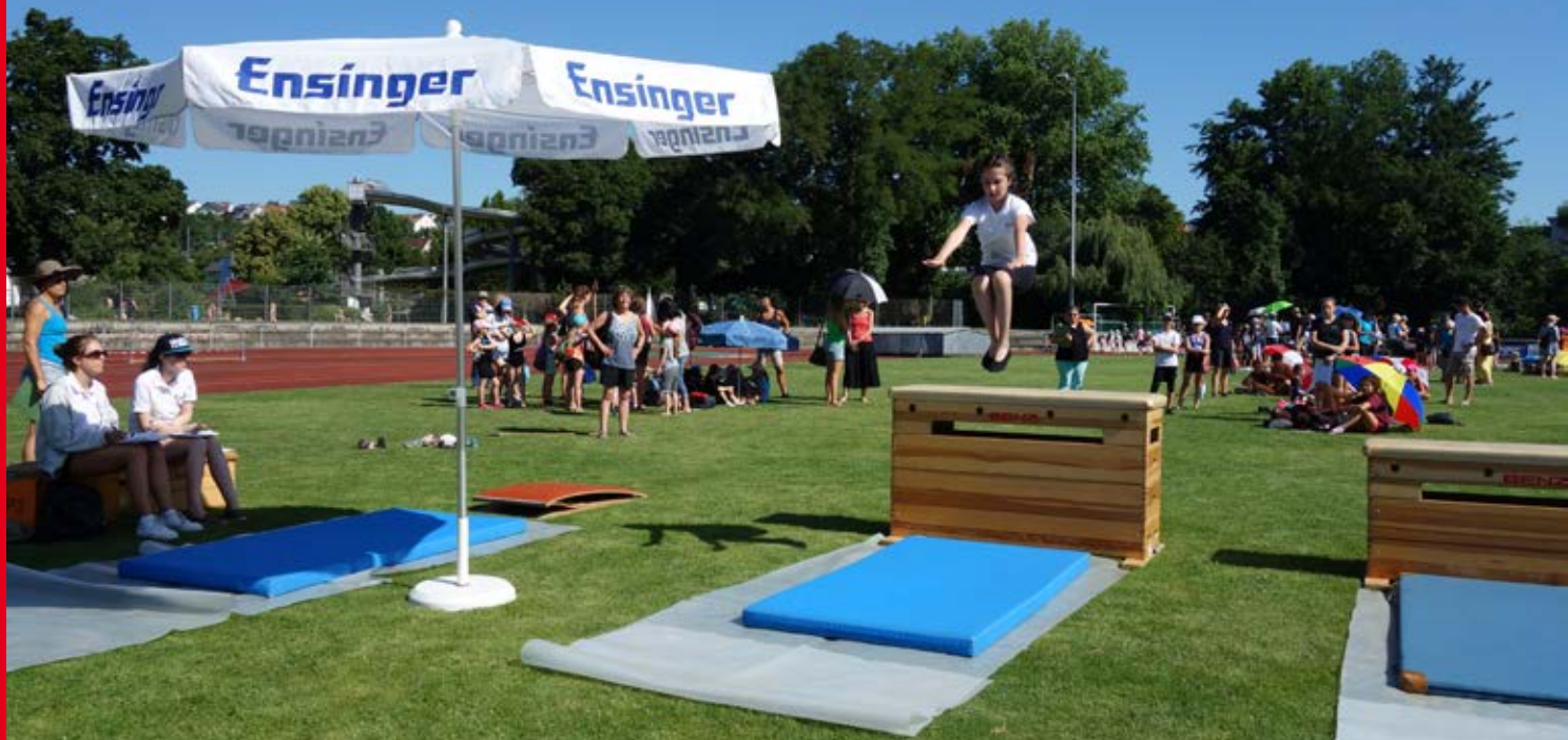
Ein schöner Hocksprung bringt viele Punkte!