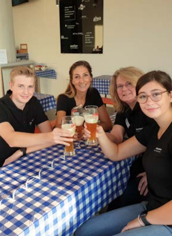
Unter dem Motto „Blau-Weiß“ startete das Mitgliederfrühstück im SportQuadrat.