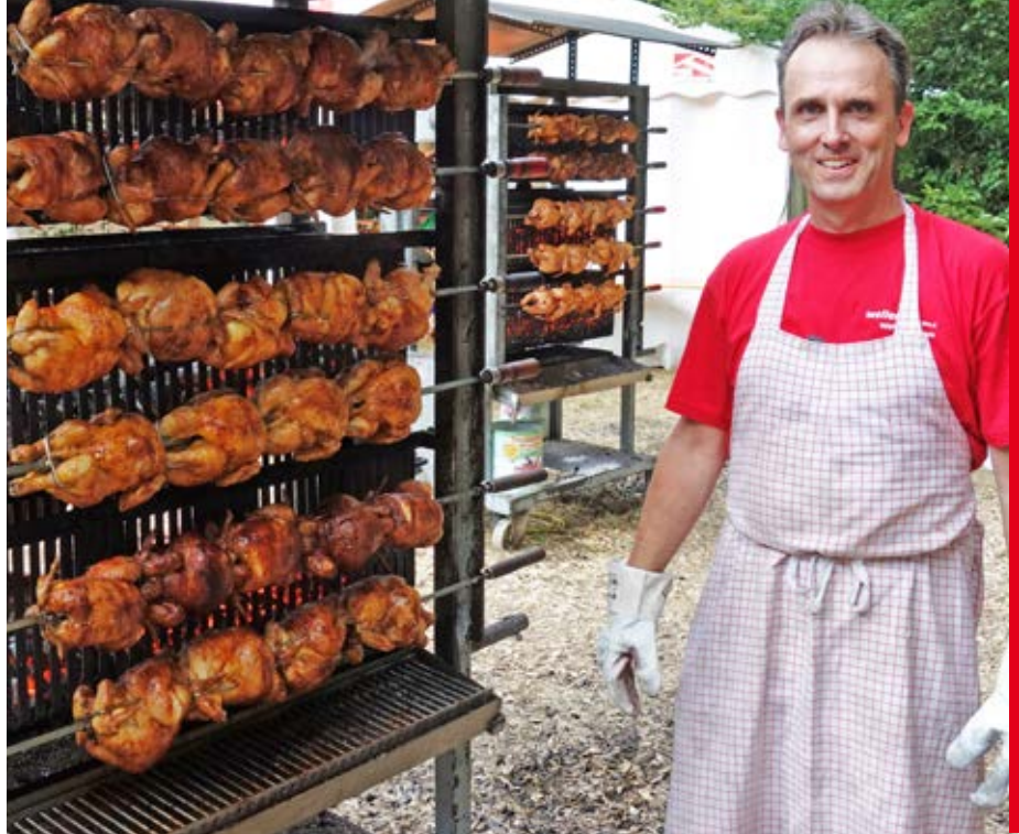
Volle Grills freuen nicht nur den Grillmeister.