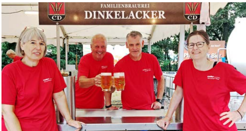
Auf dem Trockenen muss beim Waldfest niemand sitzen.

So darf man sich als Besucher beim Waldfest sicher sein, stets einen gut ausgemerkten Parkplatz, ein gemütliches Plätzchen und ganz sicher ein leckeres Essen vorzufinden. Hähnchen und Bauchbrot sind die beliebten Klassiker. Kein Wunder, beim Anblick der großen Grills, die sich kontinuierlich drehen und ganz traditionell mit Holzkohle betrieben werden. „Der Einsatz von Gasgrills wäre sicherlich günstiger, aber eben ge-