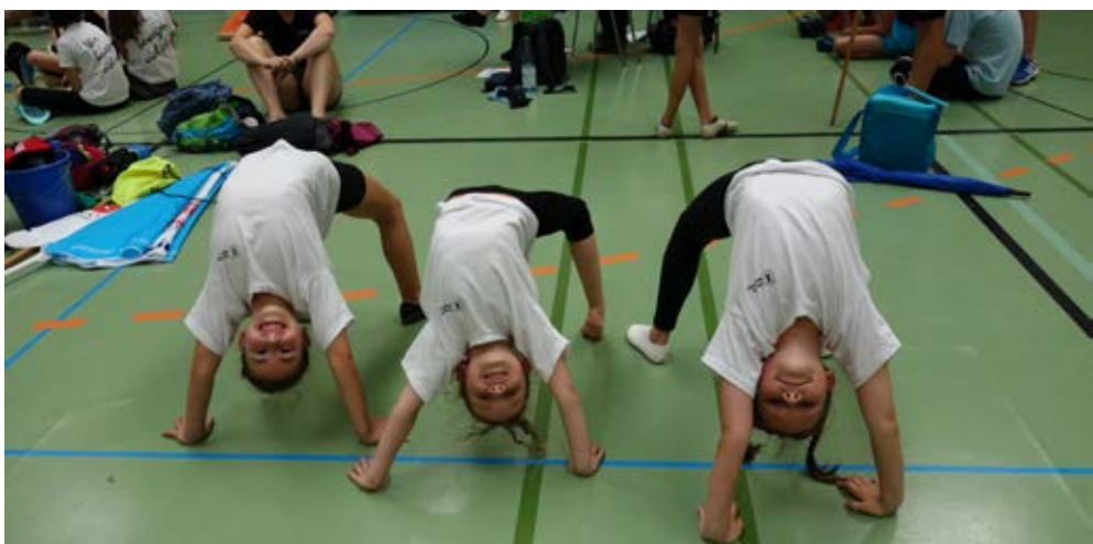
Der Spaß ist zwischen den Turnstationen nicht zu kurz gekommen.

Die Aufregung auf den bevorstehenden Wettkampf ließ die Kids des TSV vor der Fahrt zum Gaukinderturnfest nicht stillstehen. Schon früh morgens trafen sich die Wettkämpfer am SportQuadrat, um mit dem Bus nach Mühlacker zu fahren. Der Pavillon wurde aufgebaut, die Riegenführer bekamen ihre Unterlagen und die Kids turnten sich ein. Zwischen den bunten Sonnenschirmen tummelten sich die vielen TSV'ler, die auf den Wettkampfbeginn warteten. Trotz der Hitze war der große Rasenplatz im Stadion des Turnvereins Mühlacker gut gefüllt – mit fröhlichen Kids, stolzen Trainerinnen und Trainern.