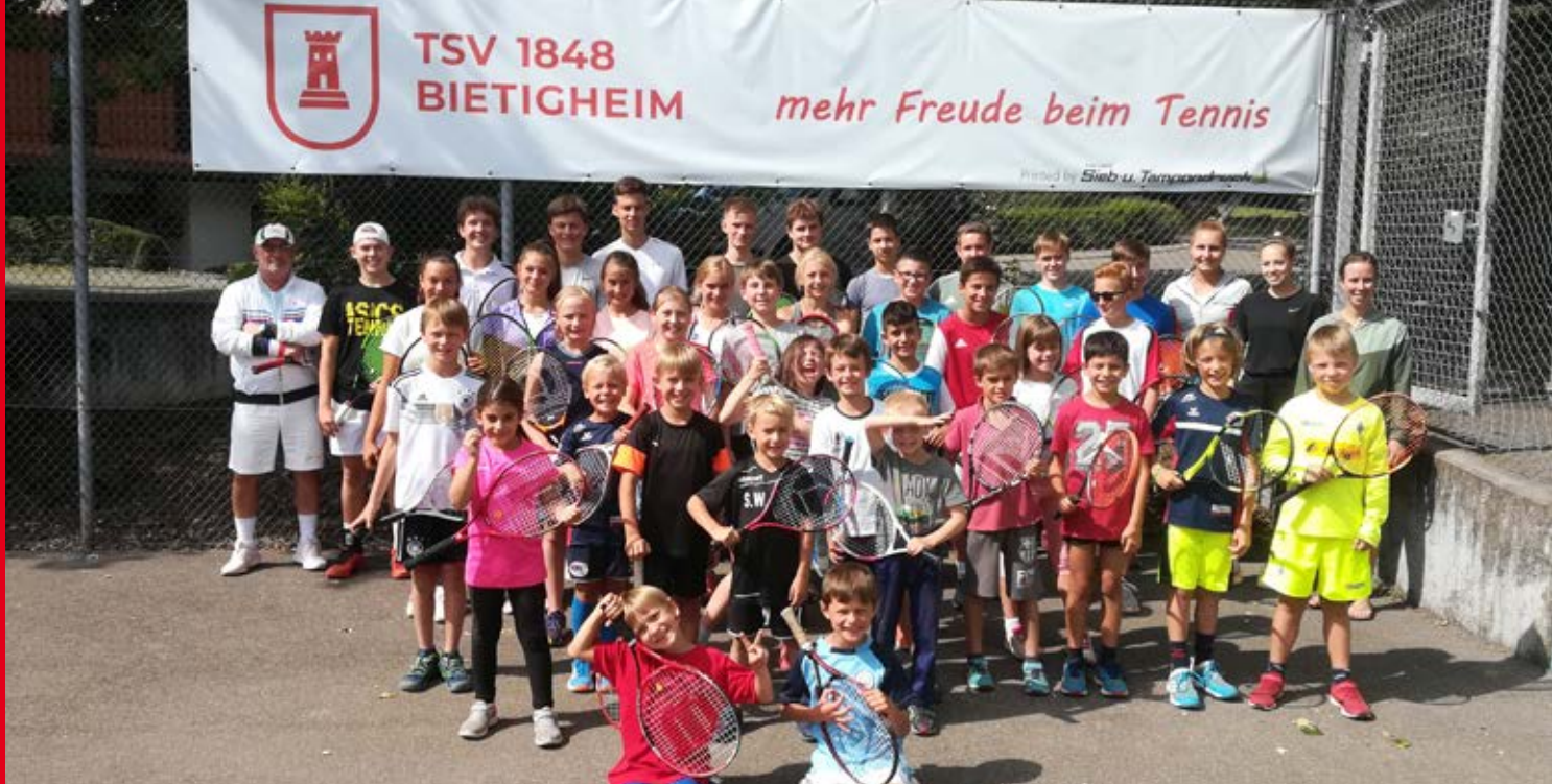
Viele Teilnehmer beim Tenniscamp.