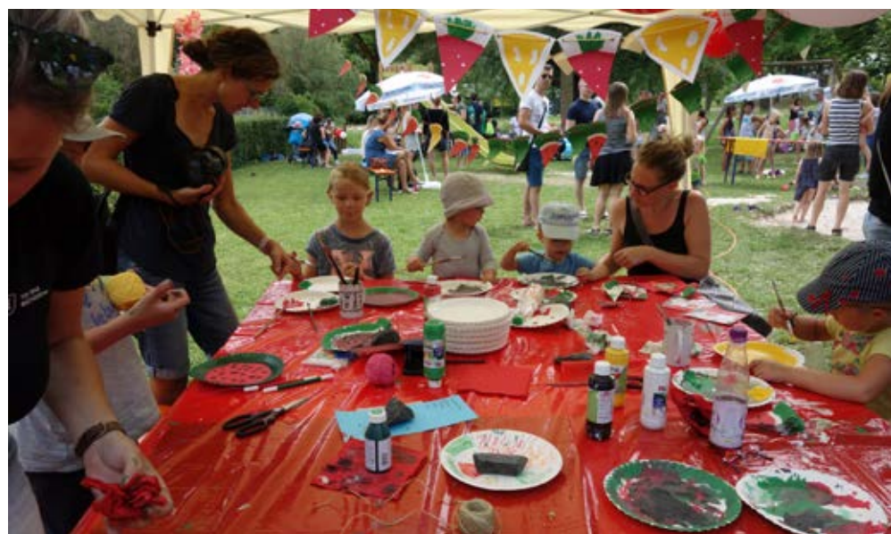
Zwischendurch wurde auch zu Pinsel und Farbe gegriffen.