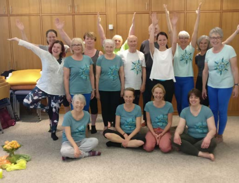
Gruppenbild der Teilnehmer am Yoga-Wochenende.