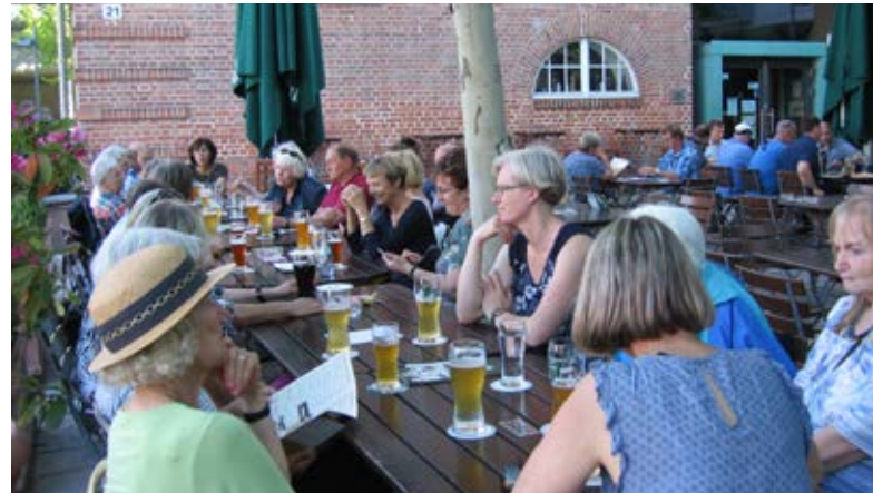
Gemeinsamer Ausklang im Biergarten.