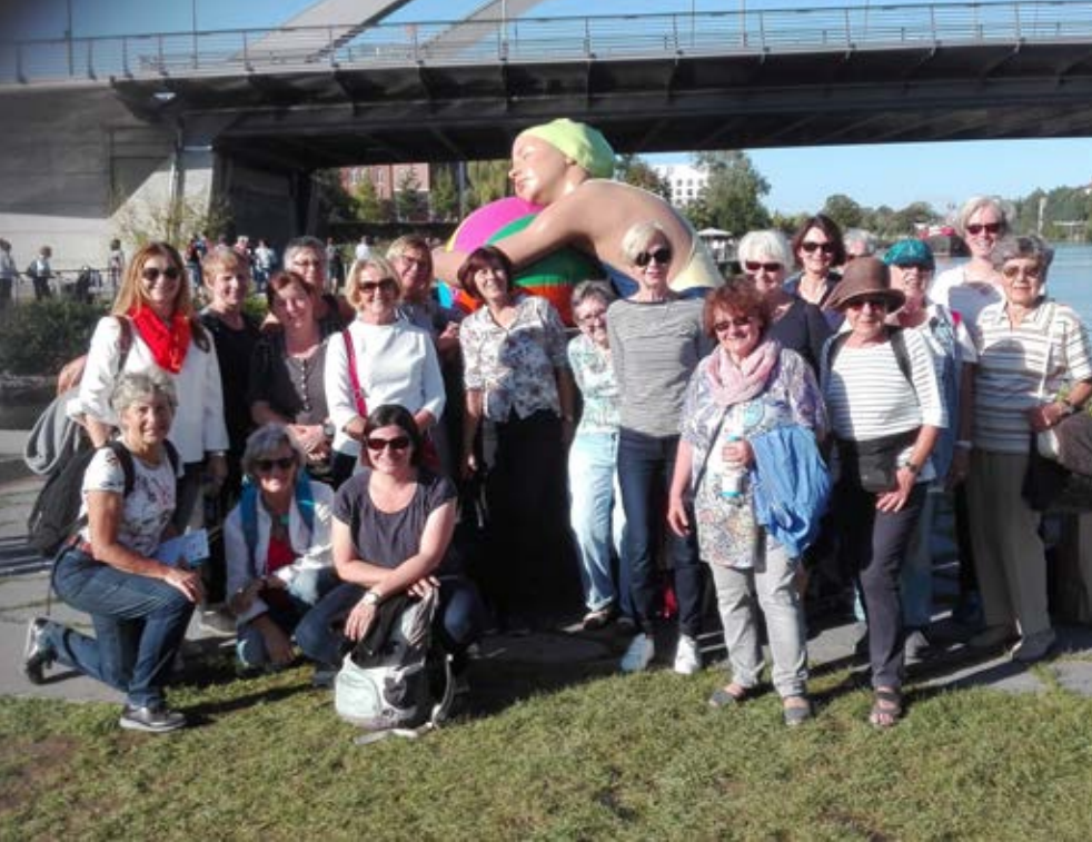
Die fleißigen Helferlein des TSV.