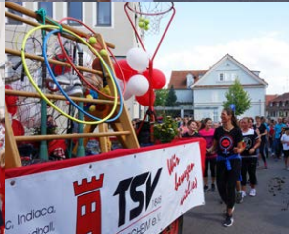
Impressionen vom Festzug.