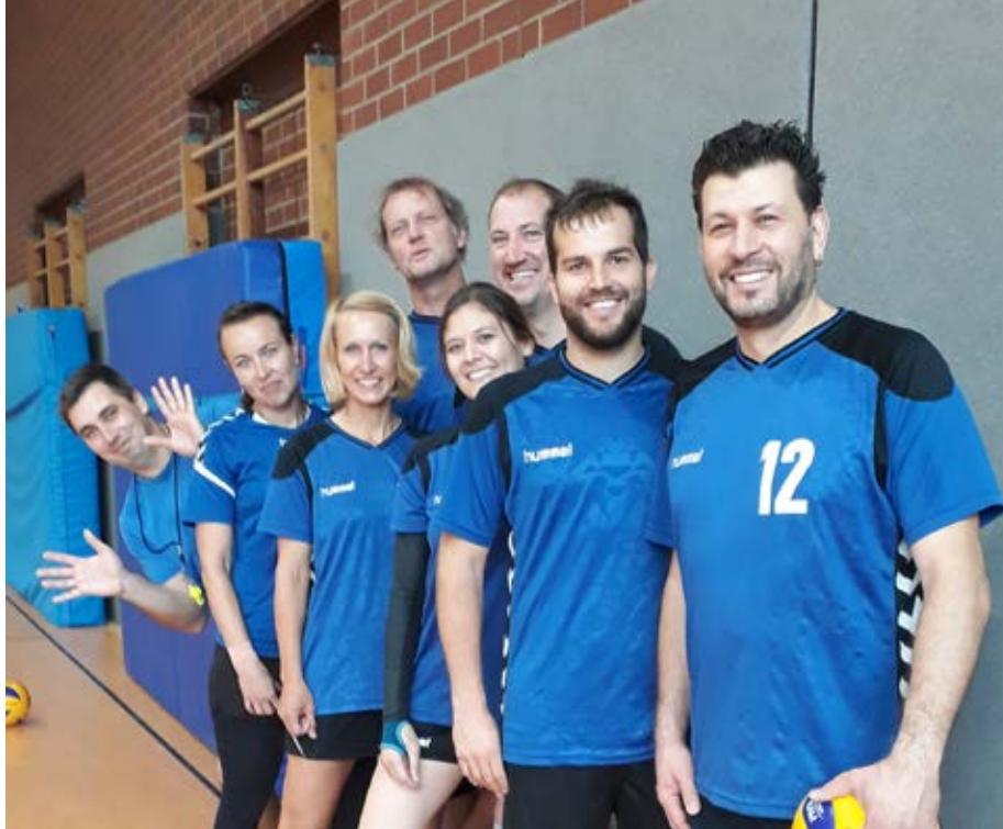
Das neue TSV-Mixed-Team freut sich über seinen ersten Sieg überhaupt.