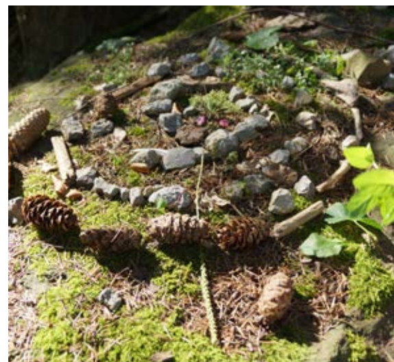
Mandala aus Naturmaterialien; Zeit zum Meditieren.