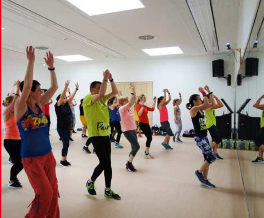
Zumba®-Party mit exotischen Rhythmen und Klängen!