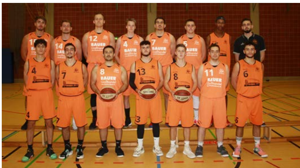
Die Herren 1 starten mit neuem Team und neuem Schwung in die Bezirksligarunde.