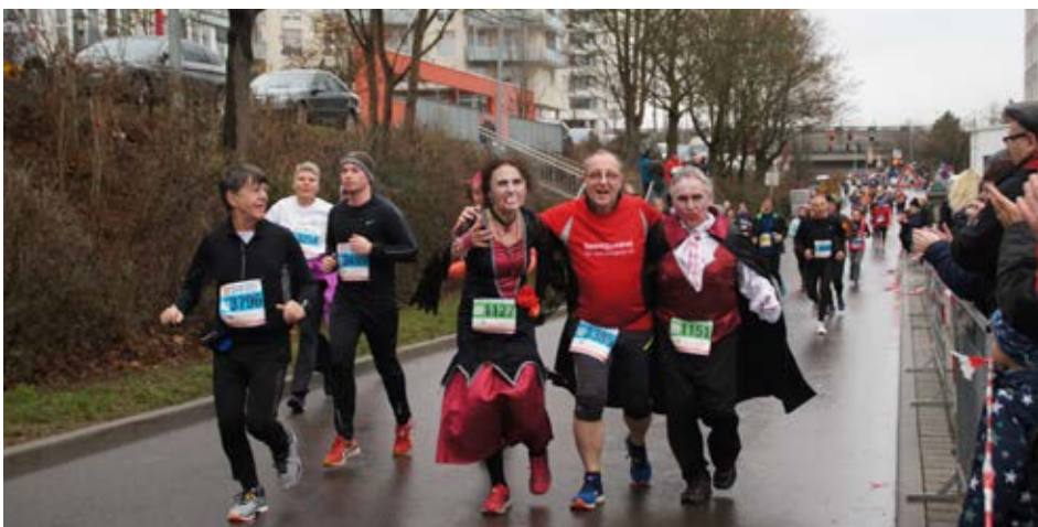
Bei allem sportlichen Ehrgeiz kommt auch der Spaß nicht zu kurz.

Zur 39. Auflage der Traditionsveranstaltung werden wieder rund 4.000 Laufbegeisterte auf der Strecke durch die Bietigheimer Altstadt und entlang der Enz erwartet. Eine einzigartige Stimmung wird auch in diesem Jahr die Läufer begleiten, ganz getreu dem Motto „HAPPY RUNNING“. Selbstverständlich ist auch der TSV als einer der Stammvereine des Veranstalters LG Neckar-Enz mit von der Partie.