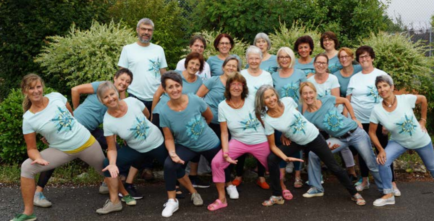
Die TSV-Yogagruppe in den neuen Shirts.