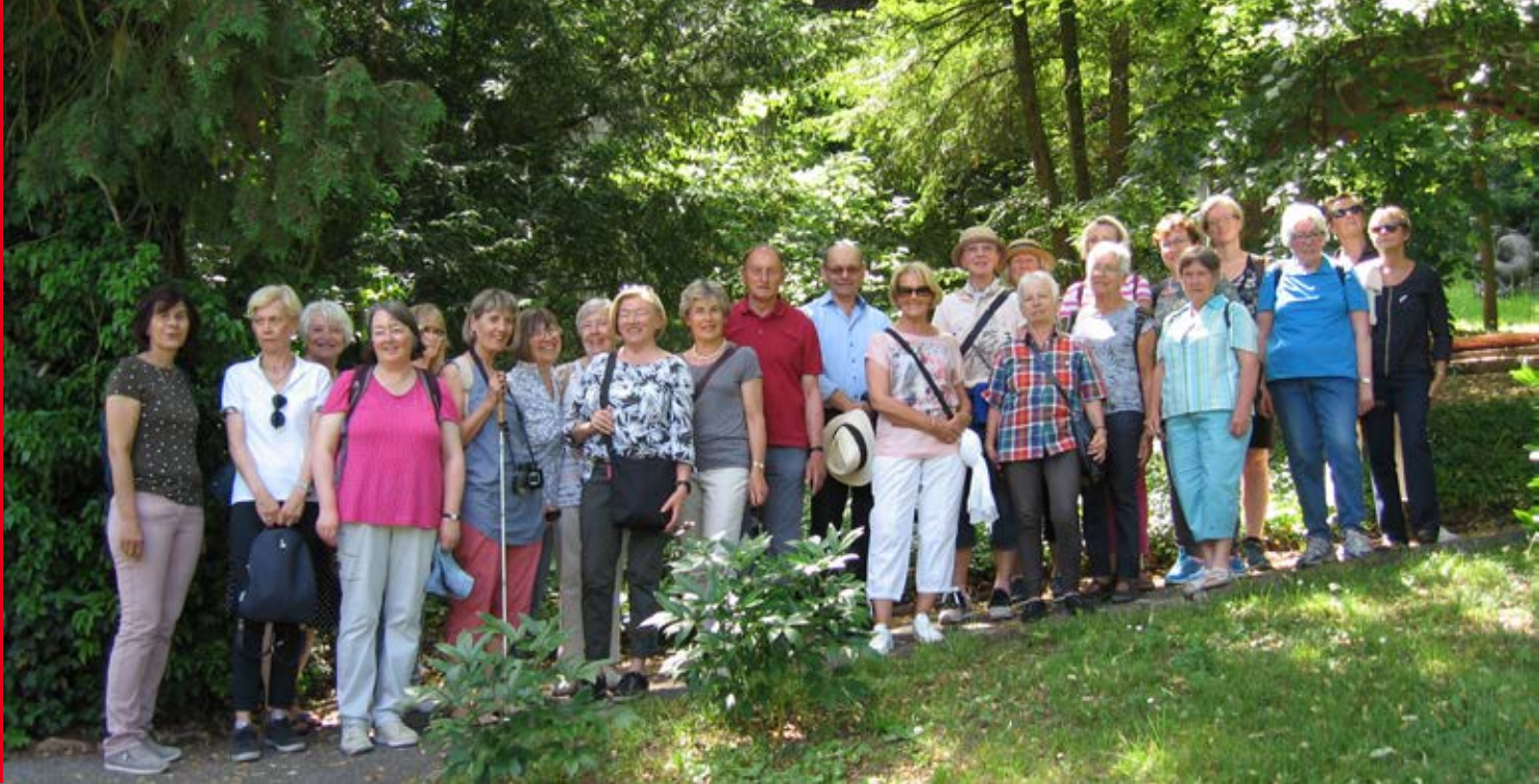
Gruppenbild der Ausflugsgruppe.