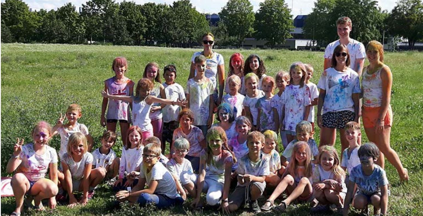
Richtig bunt wurde es beim Holi-Festival.