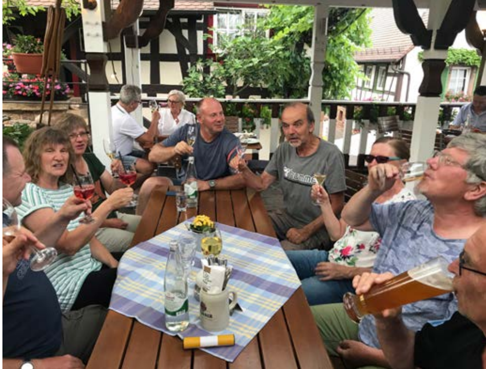
Verdiente Einkehr der Radler.

Im Garten bei sehr freundlichen Wirtsleuten, die es zudem verstanden lecker-