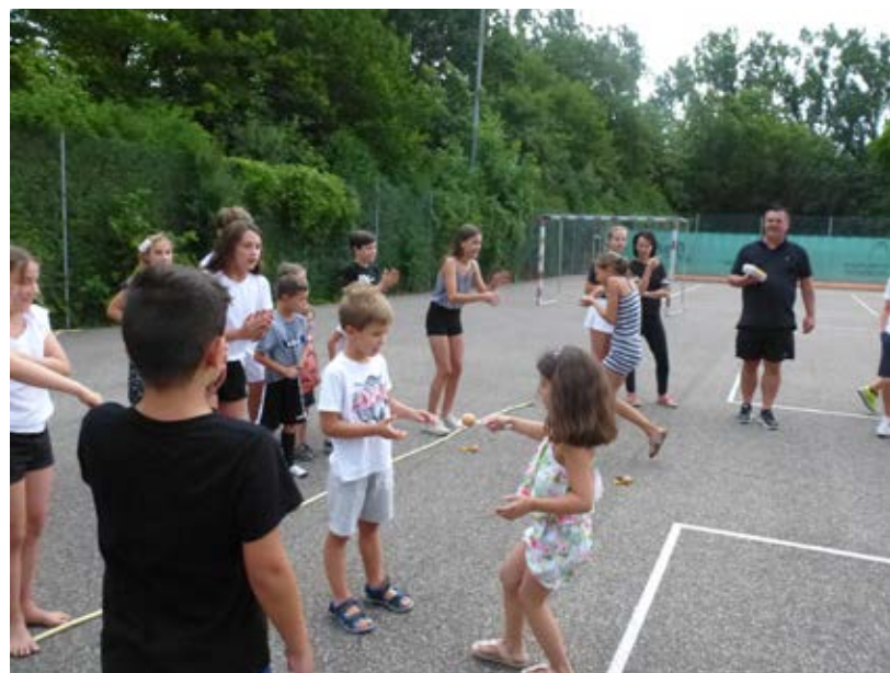
Für die Kleinsten gab es eine Kinderrallye.