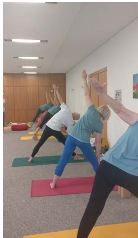
...wurde für intensive Übungen genutzt.

In Allensbach haben wir im Restaurant Seegarten dann unser Abendessen genossen. Es wurde viel gelacht und sich