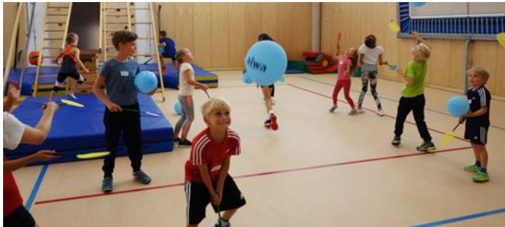
Wilder Spaß mit Fliegenklatsche und Luftballons.

Nach dem Aufwärmenspiel mit den Fliegenklatschen ging es für die Kinder an die verschiedenen Turngeräte. Ob balancieren am Barren, klettern am Actioncenter oder rutschen auf der Rollenbahn – in der Sporthalle stand dank der TSV-Organisatoren ein vielfältiger Bewegungsparcours zum Austoben bereit. Weiter konnten die Kids ihre Kreativität mit Bauklötzen, Sprungseilen oder Chif-