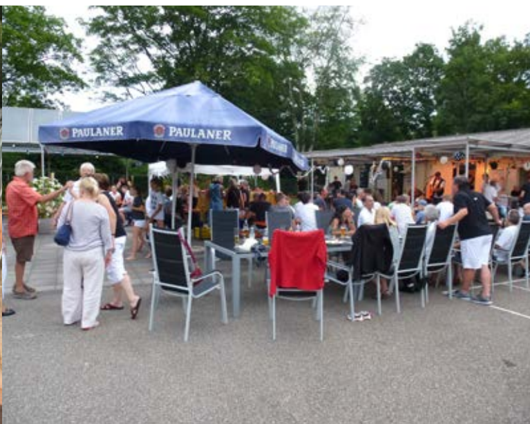
Zahlreiche Besucher kamen zum Sommerfest.

Jahr die Planung übernommen hatten. Neben einer Cocktailbar gab es mal etwas anderes – Spanferkel. Für die spontan gewordenen Vegetarier stand ein Salat-Buffett bereit. Es wurde getanzt bis in die Nacht und in diesem Jahr trudelte im Anschluss zum ersten Mal ein Bußgeld bei den feierfreudigen Tennisspielern ein... :)