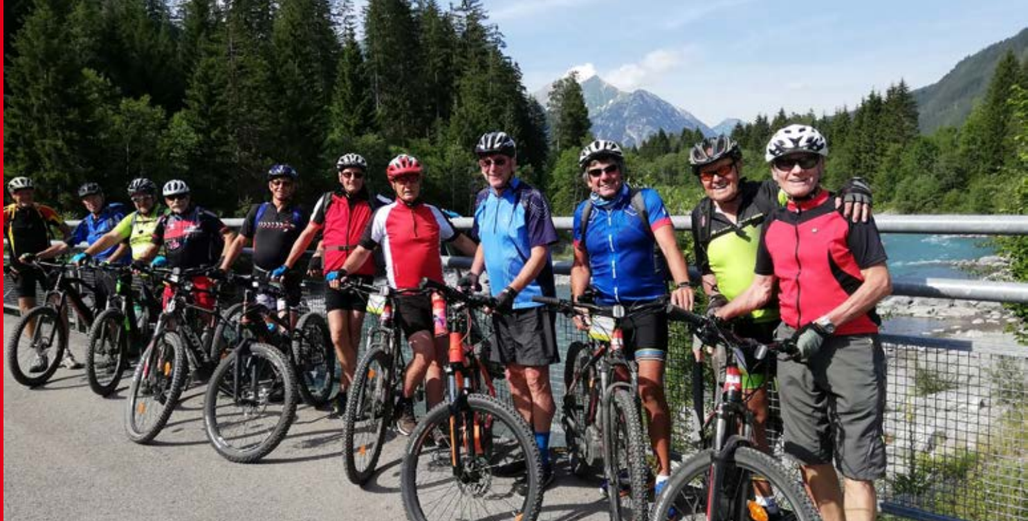
Sind regelmäßig mit dem Fahrrad unterwegs: Unsere Faustballradler.

erst ab Mitte Oktober in das Hallentraining einsteigen. Dann trainieren die M1 zusätzlich montags in der Realschulhalle in Bissingen. Für die Hallenrunde gilt es wieder, in den Spieltagen das Optimum abzurufen. Los geht's mit dem Doppelspieltag am 24.11.2019 in der Gymnasionssporthalle im Ellental. Dort spielen morgens die M45 in der Gauliga und nachmittags unsere M60 in der Verbandsliga. Bitte Termin unbedingt vormerken, die Faustballer freuen sich auf Eure Unterstützung.