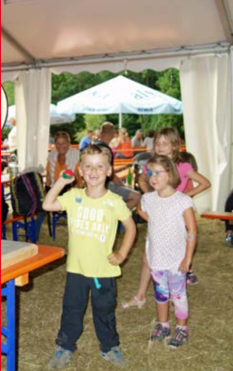
Das schlechte Wetter am Sonntag konnte den Kindern den Spaß nicht verderben.