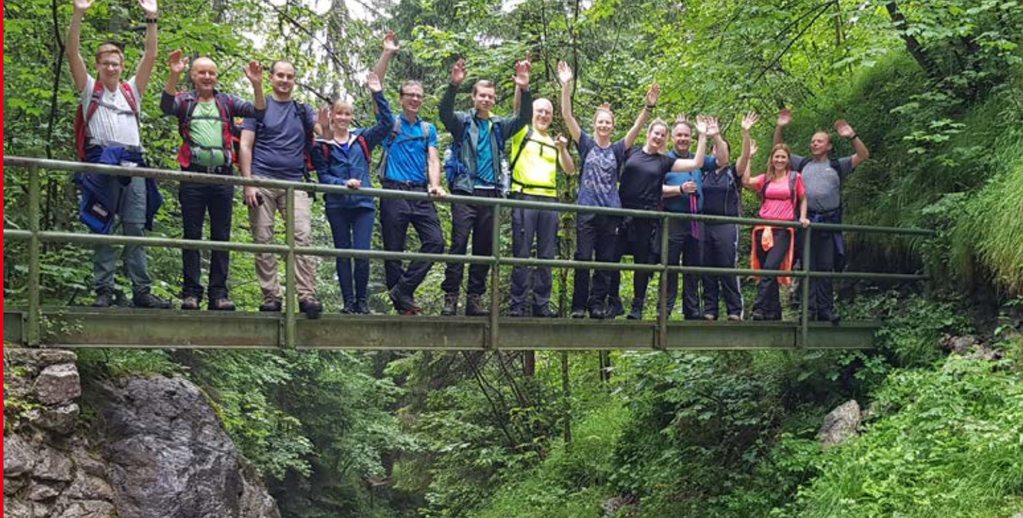
Die Abteilung Badminton bei ihrem Jahresausflug 2019, der Hüttenwanderung in Bad Hindelang.