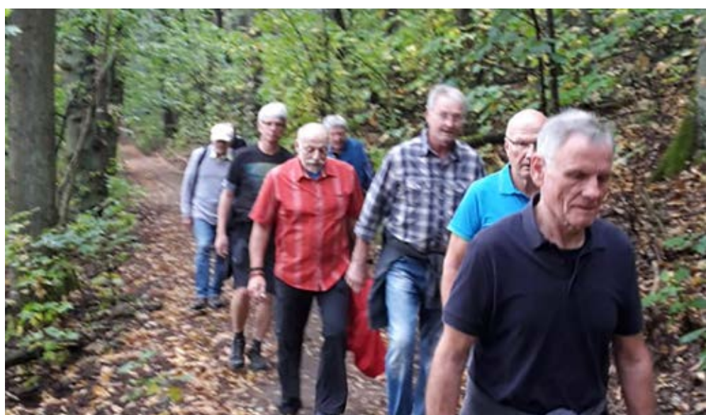
Im Pfälzer Wald auf Schusters Rappen.