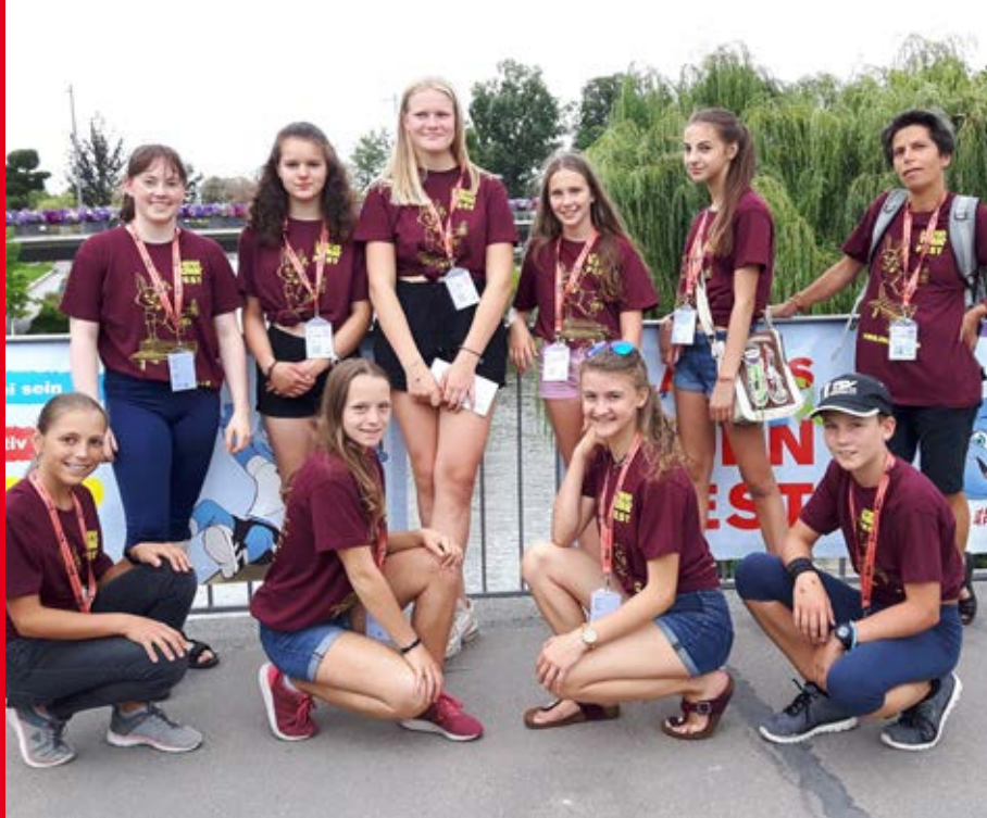
Das Turnfest-T-Shirt darf auf keinem Bild fehlen!