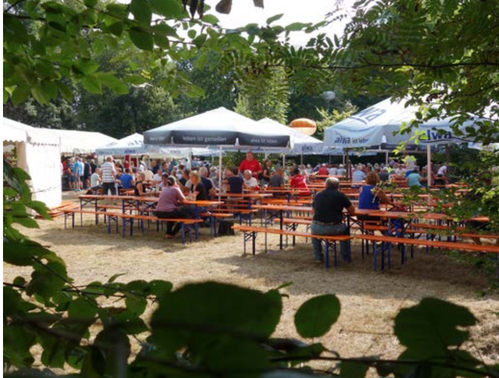
Der Festplatz im Wald sorgt für eine einzigartige Atmosphäre.