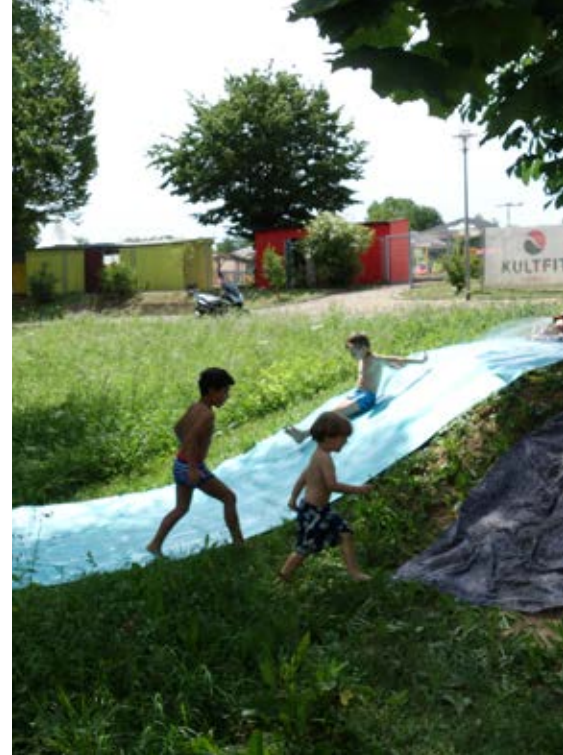
Abkühlung auf der Seifenrutsche.