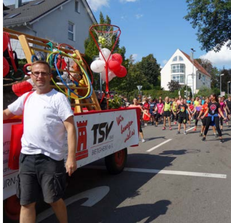
Bei herrlichem Wetter ...