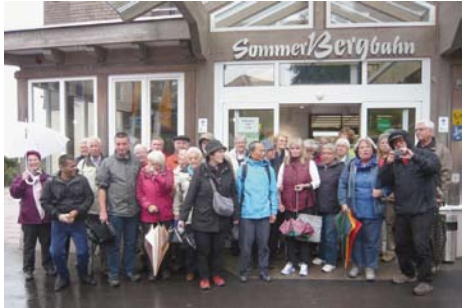
Die TSV-Senioren auf Tour.