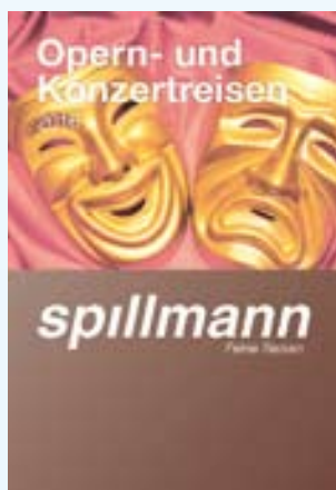
Opern- und Konzertreisen