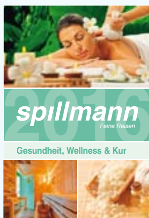
Gesundheit, Wellness & Kur