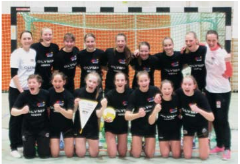
Die weibliche C1 verteidigte den Titel des württembergischen Meisters.