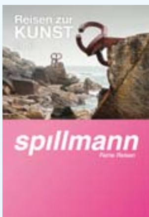
Reisen zur Kunst