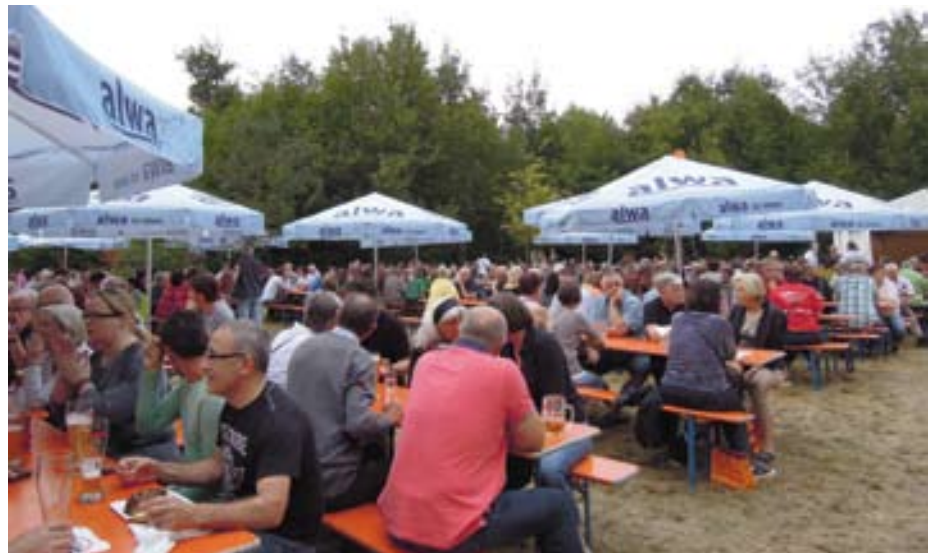
... und den Ansturm meistern.