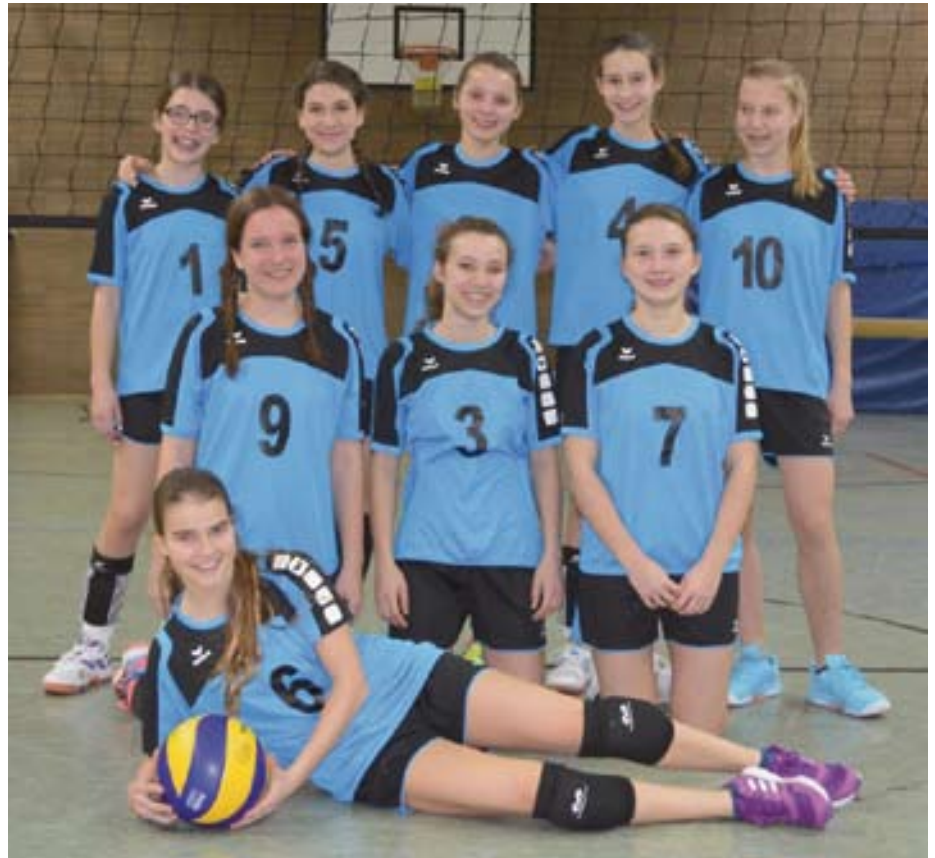
Die U17 des TSV Bietigheim.

Die U17 bestritt am 27. Februar in Markgröningen ihr erstes Vorrundenturnier. Schon im zweiten Spiel gelang die Sensation: Das Team konnte gegen den TSV Kleinsachsenheim einen Satz gewinnen! Auch die restlichen drei Spiele kämpften die Mädchen mit Herz und zeigten schöne Spielansätze. So gehen sie voll motiviert am 12. 3. in Pfedelbach in die Zwischenrunde und rechnen mit einem ersten Sieg.