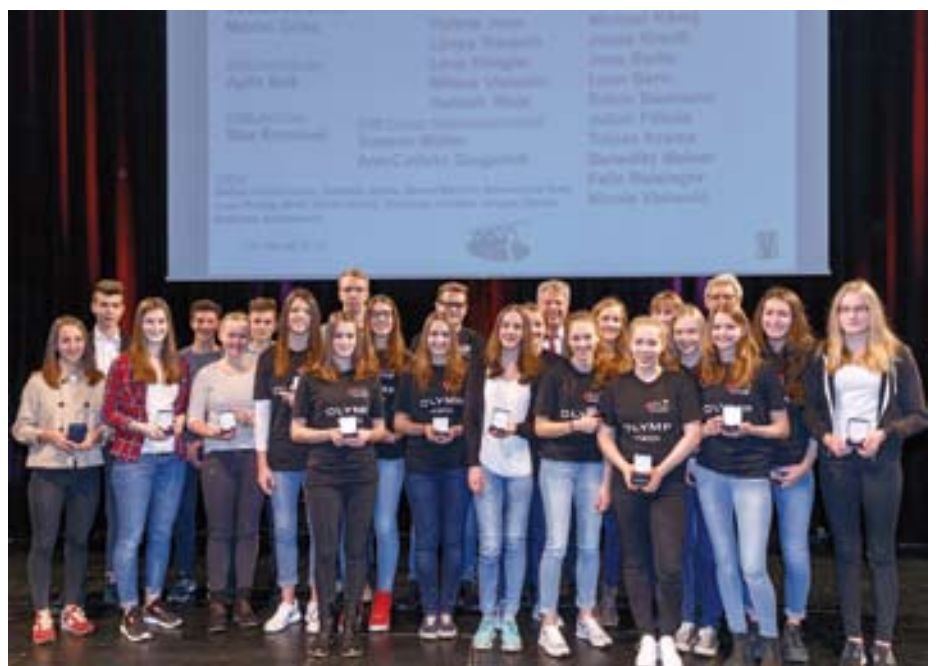
Die Handballer der SG BBM sahen ab!

Die Spielerinnen der weiblichen C-Jugend der Handball-Spielgemeinschaft erhielten für den Erfolg zum Württembergischen Meister und Baden-Württembergischen Pokalsieger jeweils die Bronzemedaille. Zahlreiche Auswahlspielerinnen und -spieler der SG wurden für die Berufung in den