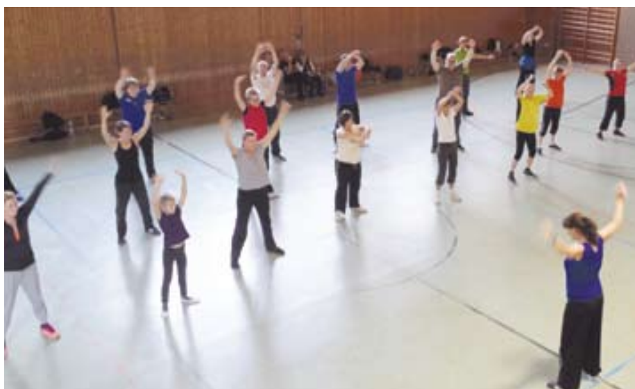
Gruppe 2 in Aktion.