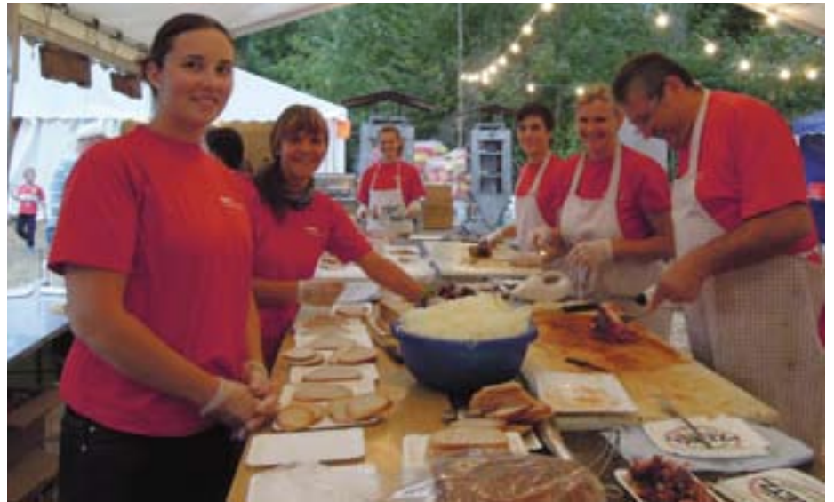
Gemeinsam anpacken ...