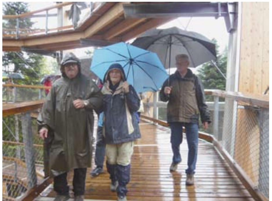
In den Baumwipfeln bei Regen, Regen, Regen ...